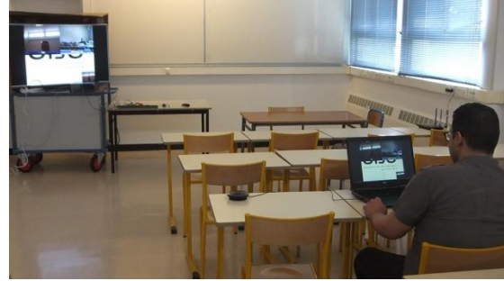
Figure 2 : l'ensemble mobile intégré en test de visioconférence multipoint.

Sur la desserte roulante se trouve le téléviseur 3D 4K et une unité centrale compacte de PC posée à plat et hébergeant le logiciel de visioconférence Ekiga. La partie droite de la figure 2 montre un test du système en visioconférence multipoint dans une philosophie BYOD. Les essais ont été effectués entre une salle à se trouvisioconférence Avaya.