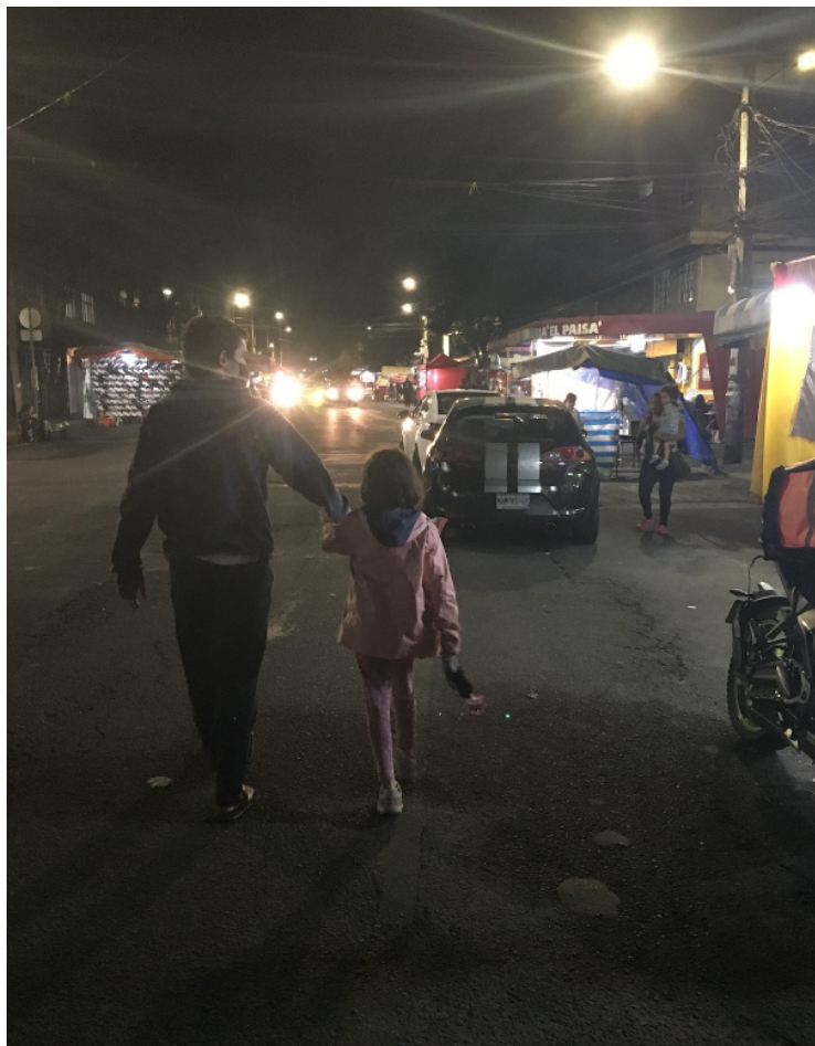
Figura 5. Habitantes de la colonia circulan por la calle de estudio