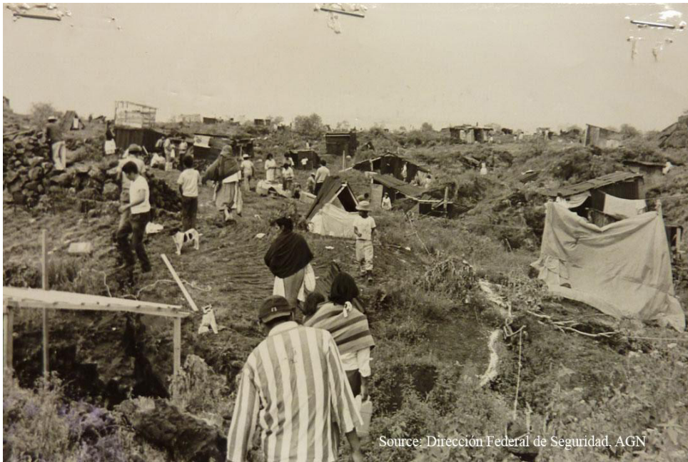
Figura 2. Primeros colonos de la colonia de Santo Domingo en 1971