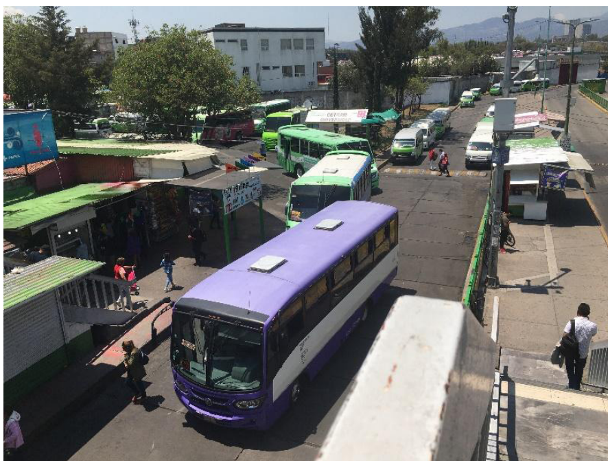
Figura 3. El CETRAM Universidad, ubicado entre Santo Domingo y la UNAM

Nuestra calle de estudio surge a un costado del Centro de Transferencia Modal (CETRAM) donde convergen una línea del metro, quince líneas de colectivos y un sitio de taxis (Figura 3).