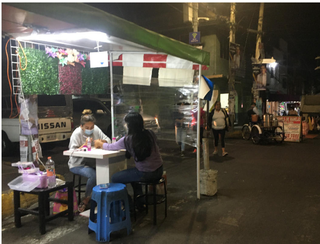
Figura 4. Puesto de manicure