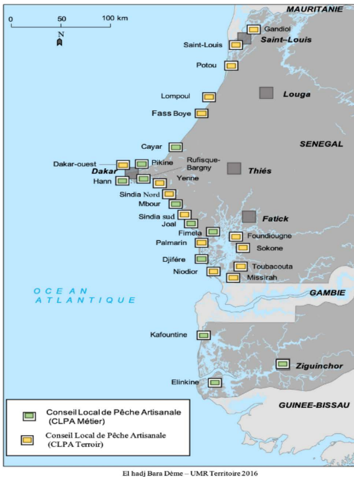
Figure 2. Distribution le long du littoral sénégalais des 27 conseils locaux de pêche artisanale mis en place par le gouvernement et les acteurs locaux de 2004 à 2018