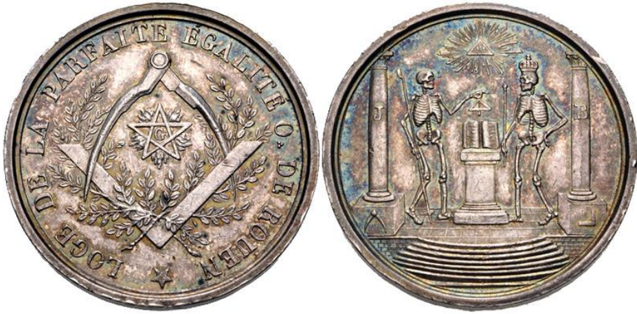
Fig. 8. France, Rouen, jeton de la loge de la Parfaite égalité, sans date (XIX e siècle), argent, 12,35 grammes

Il existe aussi au XIX e siècle de nombreuses médailles et jetons à décor macabre émis par le monde de la médecine et la franc-maçonnerie. Les progrès de la médecine sont fulgurants au XIX e siècle, portés par les universités, l'esprit scientifique, une meilleure circulation des informations et une volonté politique d'éradiquer les grandes maladies. Les sociétés de médecins reprennent une thématique qui était déjà utilisée auparavant 15 mais le squelette n'est désormais plus que le symbole de la maladie vaincue par la médecine ou plus simplement le squelette de cours d'anatomie, squelette humain (médaille commémorant le dévouement des médecins français lors de l'épidémie de Barcelone en 1821) ou animal (jeton de la société médico pratique, 1808). En 1899, la Société (française) de biologie fête son cinquantenaire et, sur la médaille frappée à cette occasion, on voit une femme sortant d'un tombeau en soulevant son linceul et, plus curieux, un crâne de triceratops... Peut-être en lien avec la corporation des médecins, les francs-maçons utilisent aussi la thématique macabre comme la Loge de la parfaite égalité, orient de Rouen. Au revers de la médaille, dans un temple symbolisé par deux colonnes et une volée de marches, figurent deux squelettes encadrant un autel, sous le regard du Grand Architecte symbolisé par un œil rayonnant dans un triangle.