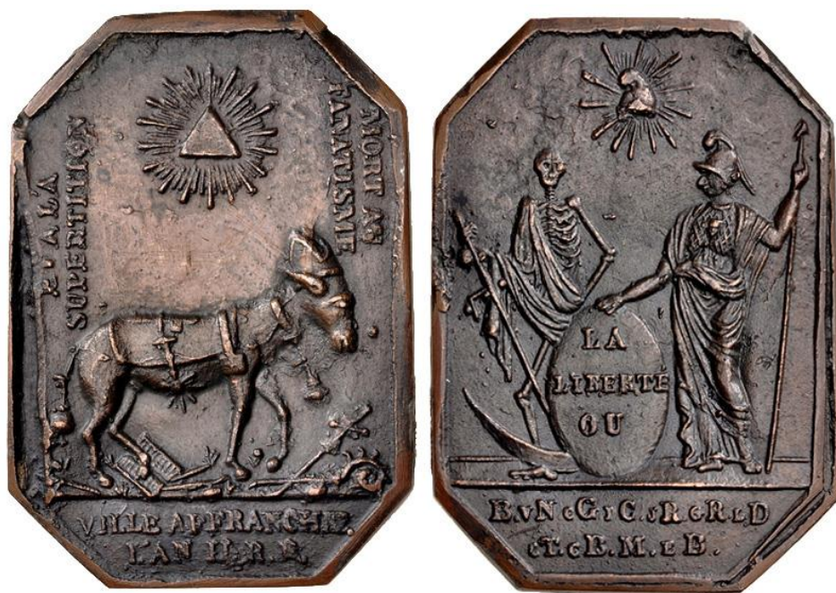
Fig. 5. France, plaquette satirique, « La liberté ou la mort », 1793, bronze, 22,29 grammes