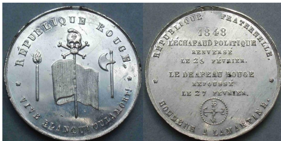
Fig. 6. France, médaille, « Vive Blanqui oui la mort », 1848, étain, 21,92 grammes

À la fin du XVIII e siècle, la représentation macabre prend un tour plus politique. Dans l'espace français, la Révolution génère des représentations macabres. Toutefois, elles se limitent à quelques unités toutes regroupées autour d'un thème, la liberté ou la mort. On peut même voir un jeu de mot sur certains objets puisque le mot « mort » n'apparaît pas, remplacé par un squelette. Il s'agit de médailles et de plaquettes de fabrication privée, sans doute issues des clubs révolutionnaires. Elles sont assez peu nombreuses proportionnellement aux documents numismatiques produits durant cette période car, contrairement à ce que l'on pourrait imaginer, la Révolution française n'est pas très productive en médailles macabres : les révolutionnaires insistent plus sur les Lumières et les nouveautés que sur les aspects les plus sinistres de l'époque.