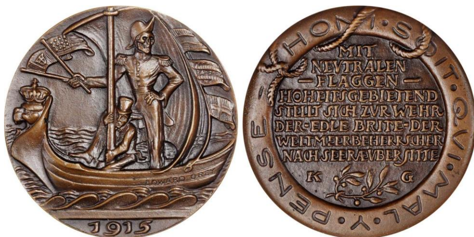
Fig. 9. Allemagne, 1915, médaille de Karl Goetz, bronze, 68,63 grammes

Avec la Première Guerre mondiale, c'est à nouveau l'espace germanique qui en use abondamment, l'Allemagne tout spécialement, et, dans une logique politico-guerrière, pour dénoncer la violence de ses ennemis, thématique exploitée encore dans l'immédiat après-guerre. Elle s'exprime par une multiplication des objets associant la mort aux vainqueurs du conflit, les Français en particulier. Le thème macabre peut être associé au thème sexuel, celui du viol en particulier. L'iconographie est très expressive et la médaille est alors un instrument de propagande politique. La Grande Faucheuse figure sur une médaille de 1914 mais c'est à partir de l'année suivante et jusqu'au milieu des années 1920 qu'elle rencontre le plus de succès, gagnant jusqu'à certains billets de nécessité 16 .