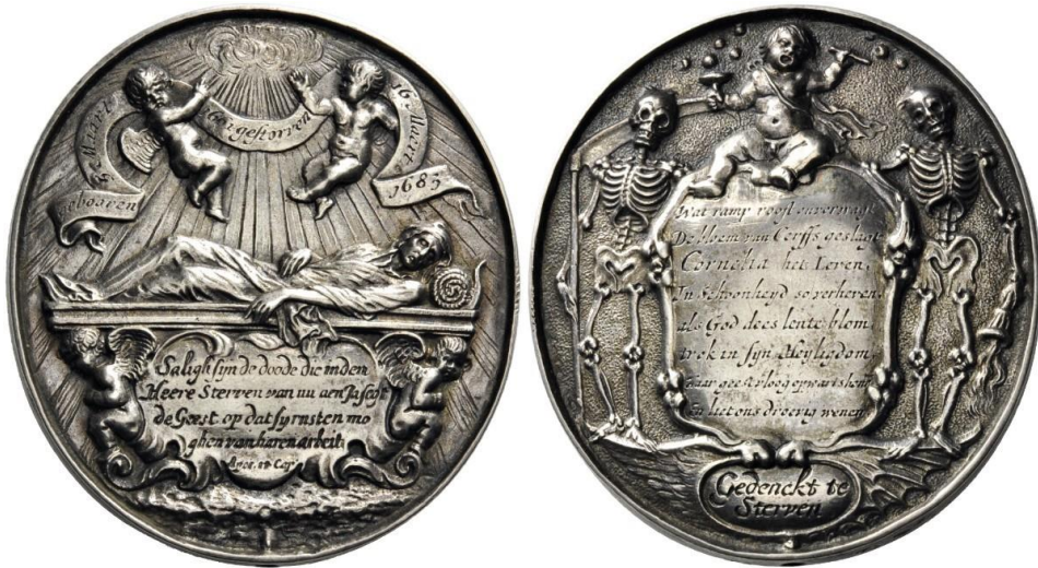
Fig. 4. Pays-Bas, Amsterdam, médaille funéraire au nom de Cornelia de Cerff, 16 mai 1683, argent, 96,20 grammes

choisissent des représentations moins lourdes, squelette tenant des armoiries, squelette à côté du tombeau, comme sur la médaille de l'empereur Charles VII, mort en 1745. À un niveau social moindre, les Pays-Bas se caractérisent par une série de médailles ovales à thème macabre pour rappeler les décès de personnages, y compris des femmes, de la bourgeoisie ou de la noblesse 13 . Elles allient un squelette qui tient une torche allumée, une faux et des putti . Le putto peut être remplacé par un Bacchus enfant, aviné et chantant 14 .