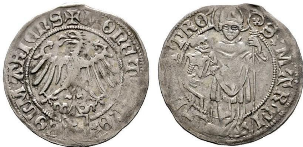
Fig. 1. France, Colmar, Plappert, vers 1480, billon, 1,72 grammes