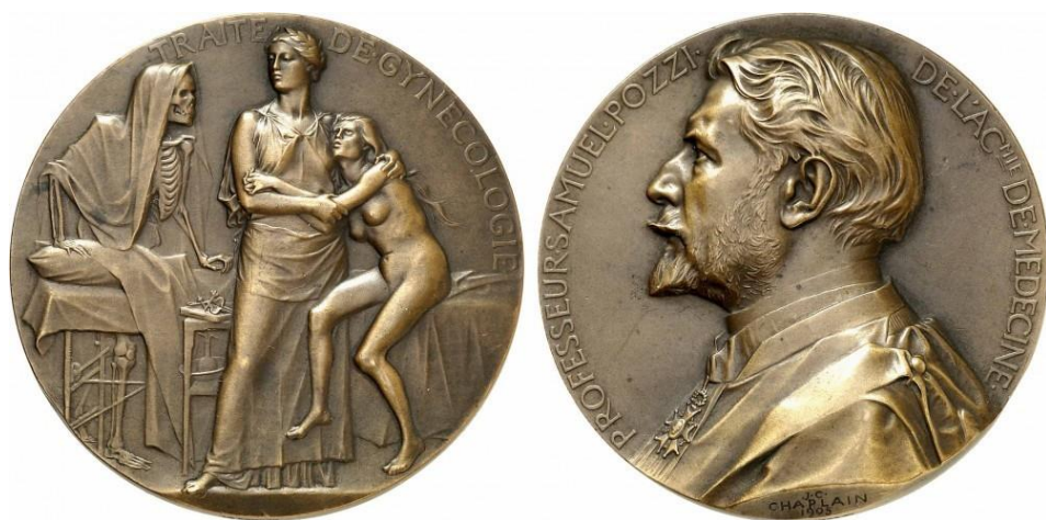
Fig. 7. France, médaille en l'honneur du professeur Samuel Pozzi, 1905, bronze, 129,27 grammes

à côté d'une tête coupée plantée sur une pique, soit un prisonnier enchaîné dans sa cellule, ou encore le profil du roi et de la reine. On comprend facilement l'intérêt que peuvent alors trouver les adversaires de la France à diffuser de telles images. En revanche, c'est bien en France que l'on montre cet instrument de mort durant la Seconde République. Plusieurs médailles, datées de 1848 et 1849, qui dénoncent des exécutions commises « par la réaction », sont émises par la section armée des droits de l'homme et du citoyen. Dans le même temps, on assiste à un renouveau de la représentation macabre en France, lié à un retour iconographique de la thématique de 1789. Crânes et tibias sont assez fréquents sur les médailles politiques de cette période, soit sur celles des révolutionnaires qui s'inscrivent sans doute dans la ligne la plus dure des années 1792-1794, soit sur celles de leurs adversaires royalistes qui agitent le chiffon sanglant qui a essuyé la lame de la guillotine. Le phénomène semble se limiter à la France.