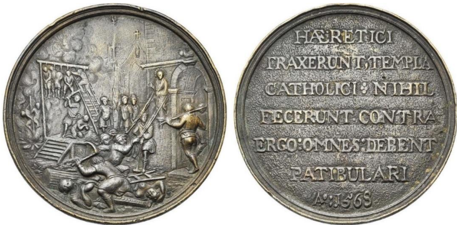
Fig. 3. Pays-Bas méridionaux, médaille, répression des émeutes iconoclaste, 1568, bronze, 55,45 grammes

(Brabant), la roue (Lorraine, associée à un crâne) ou plus tard (XVII e siècle), le sablier ailé (jetons de la confrérie des médecins hollandais). L'association crâne et tibias est aussi très fréquente (méreau des chapitres de Liège, Saint-Lambert, 1686 et divers). Les légendes rappellent aussi la fugacité de la vie, de la beauté et de la richesse ou reprennent des formules biens connues comme Hodie mihi, cras tibi (jeton de Nuremberg, sans date, représentant le tronc d'un squelette couronné d'un côté, un carré magique de l'autre). Un jeton de Hans Krauwinckel montre un squelette emportant une belle femme très richement habillée. On peut facilement relier cette image à la thématique développée dans plusieurs tableaux de Hans Baldung comme Le Chevalier, la Jeune Fille et la Mort ou encore Ève, le serpent et la Mort . À l'inverse, de nombreux jetons ou médailles à connotation religieuse rappellent le triomphe du Christ sur la mort. On y voit Jésus sortant du tombeau et frappant avec le pied d'une croix un squelette avachi sur le sol (thaler de Brunswick, 1546), ou la foi dans le même rôle sur le revers d'une médaille du pape Alexandre VII, par exemple (1658).