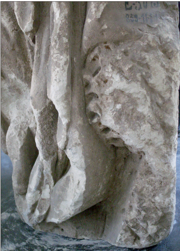
Fig. 2 (à gauche) : Jupiter capitulin de Rezé, vue d'ensemble.