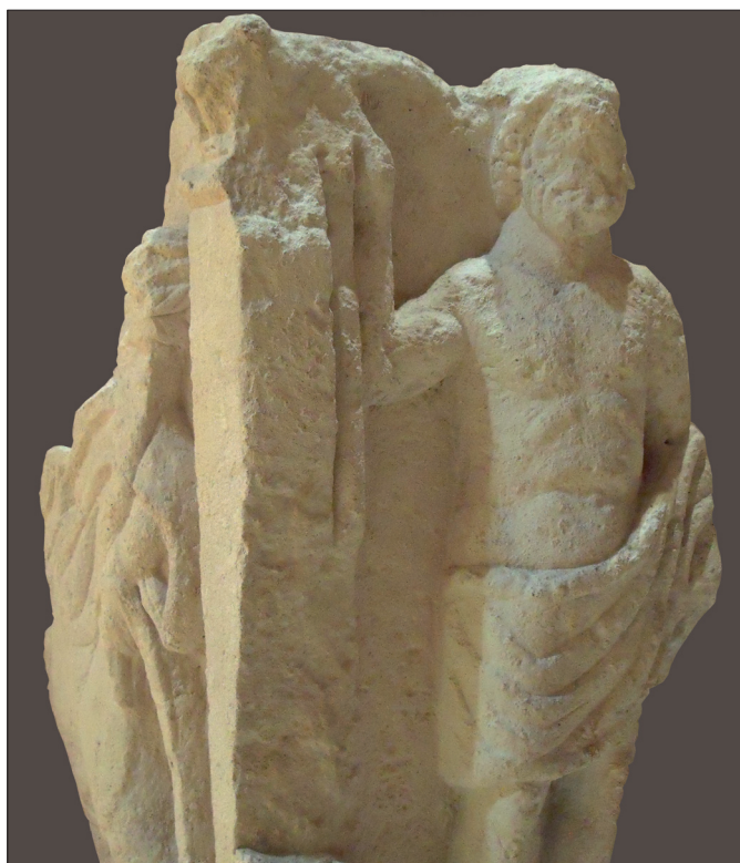
Fig. 7 : «Autel de Pareds», commune de la Caillère-Saint-Hilaire, vue d'ensemble.