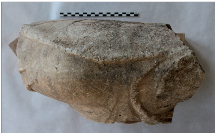
Fig. 8 : Fragment de statue féminine drapée. (a) face antérieure (b) face postérieure (c) vue de dessus : on distingue sur l'épaule une fibule.