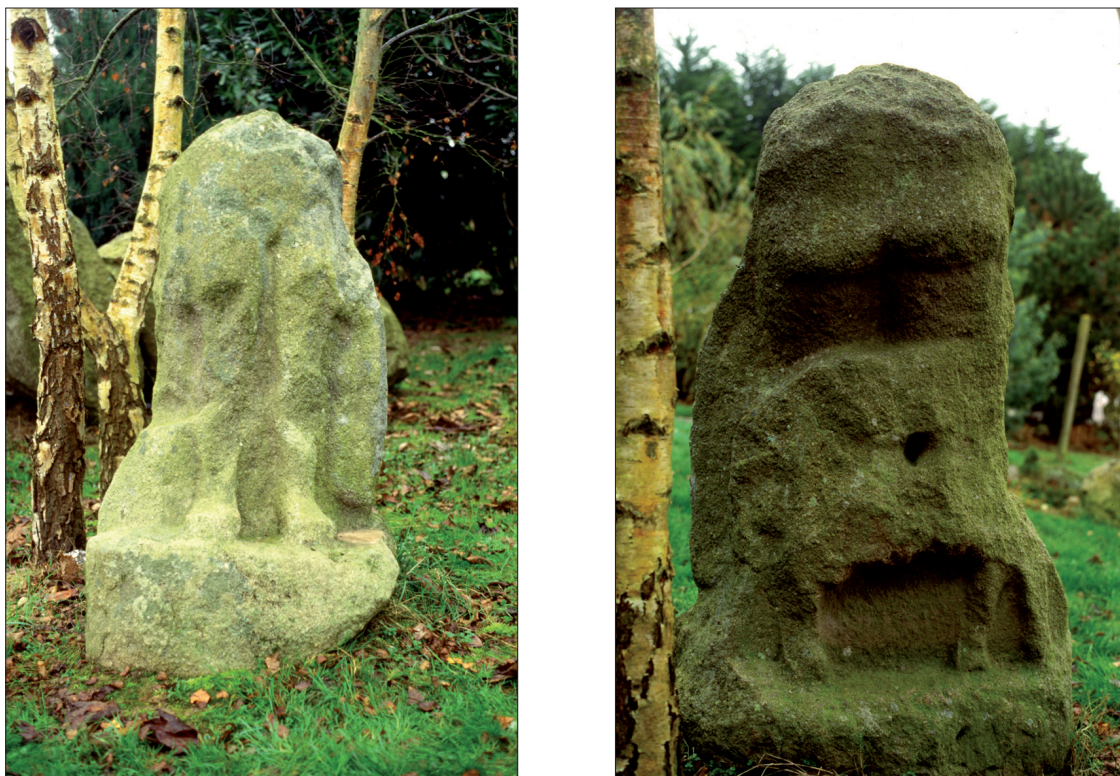
Fig. 5 : Mercure de Saint-Adrien. (a) vue de face (b) vue arrière : on distingue un bélier ou un bouc dont le corps a été bûché).