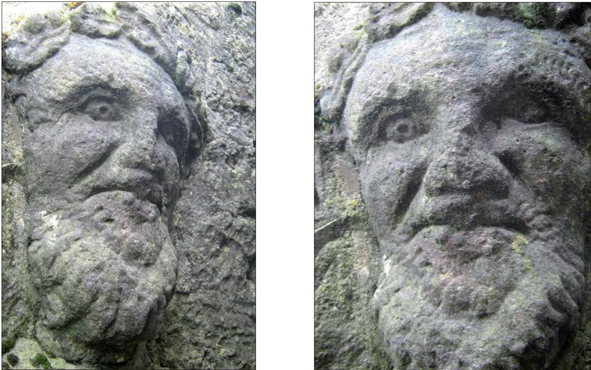
Fig. 10 : Tête de Valognes. (a) vue de trois quarts droit (b) vue de face (cl. J. Deshayes).

à l'intérieur de la bâtisse (où nous n'avons pas pu aller) et l'épaisseur, selon le propriétaire, n'excéderait pas 0,20 m.