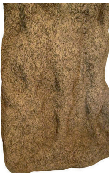
Fig. 3 : Mercure d'Elven : tortue dressée sur ses pattes contre la jambe droite (cl. Y. Maligorne).