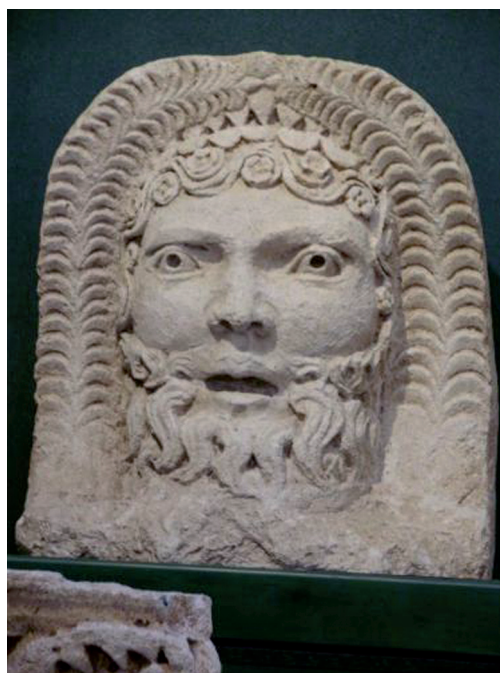
Fig. 12 : Deux larves du mausolée de Faverolles.

yeux profondément creusés et l'expression du visage est celle de l'effroi. L'existence d'un grand monument funéraire pouvant comprendre de telles sculptures n'est, a priori , pas impossible à Alauna-Valognes . Selon le propriétaire de la bâtisse, la tête n'excède pas 0,20 m d'épaisseur et l'arrière est fini, indices favorables à ce rapprochement. On peut imaginer que le masque aurait été débarrassé de son onkos et de l'empâtement de la base. Seule une extraction de la pièce, si elle était possible, permettrait de le vérifier. Il faut bien admettre que les traits du visage sont assez éloignés de ceux des larves les plus caractéristiques qui proviennent pour la plupart de la Narbonnaise ou de l'est de la Gaule. On aurait affaire à Valognes, avec cet exemple isolé, à une sorte de style « provincial », comparé aux précédents. Mais comme on ignore les conditions de sa découverte, on ne peut exclure totalement une origine moderne (XVI e -XVIII e s.) et dans ce cas une utilisation dans un contexte qui resterait à élucider.