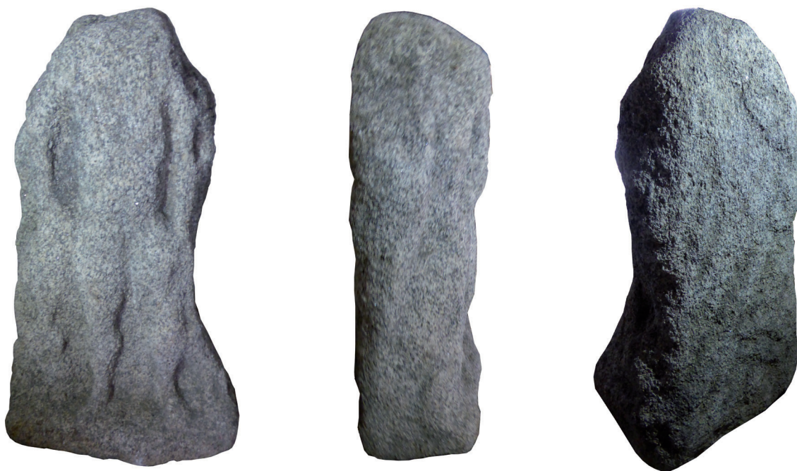
Fig. 1 : Mercure d'Elven. (a) vue de face (b) profil droit (c) vue de l'arrière.

On reconnaît un personnage de sexe masculin, nu, que la présence du caducée contre le flanc gauche permet d'identifier sans hésitation au dieu Mercure. La bourse, qui est habituellement le pendant du caducée, est plus difficilement distinguable. Contre la base de la jambe gauche, on reconnaît un coq et contre la jambe droite, plus effacée, une tortue dressée sur ses pattes arrière (fig. 2 et 3). Ce sont là deux des animaux les plus fréquemment associés à Mercure. Si l'on parvient à faire abstraction des détériorations, la facture peut être qualifiée de moyenne. Le personnage est dans l'attitude du contrapposto, en appui sur la jambe droite tendue, la jambe gauche légèrement fléchie et décalée vers l'avant. La morphologie est plus ou moins bien rendue : le tronc semble trop grêle et trop allongé, la musculature des cuisses et des mollets est fortement accentuée. Pour utiliser une comparaison locale, la facture paraît sensiblement inférieure à celle du Neptune de Douarnenez découvert en 2004 6 (fig. 4).