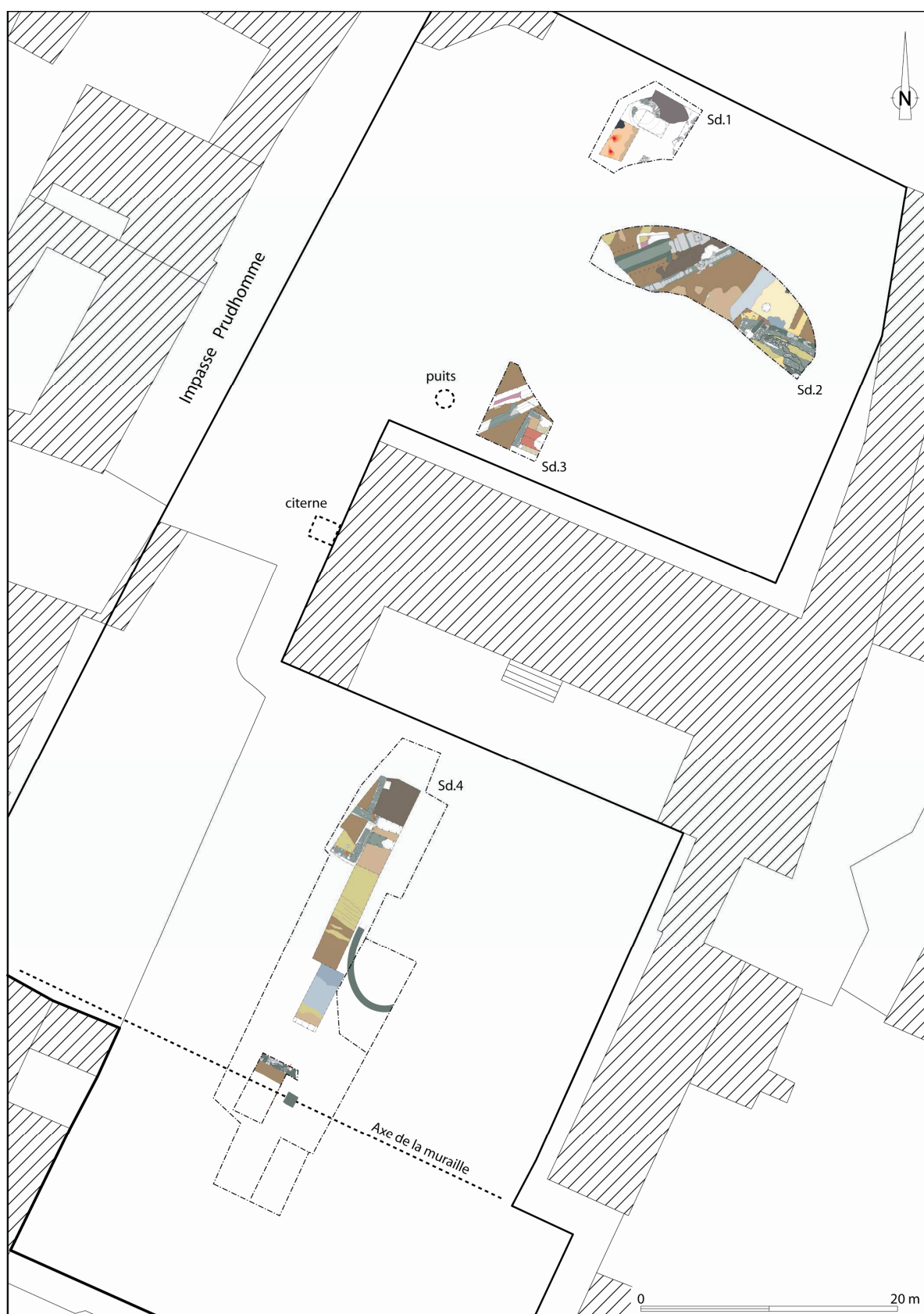
Fig. 6 : Situation des sondages de 2006 dans la cour de l'Hôtel du Doyen à Bayeux (le sondage n° 1 est le plus au nord).