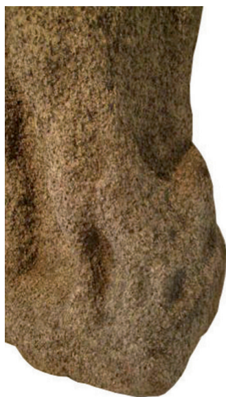
Fig. 2 : Mercure d'Elven : coq contre la jambe gauche.

Particularité technique importante, le personnage se détache en relief sur un fond plein, légèrement débordant de chaque côté, c'est-à-dire que la sculpture doit être définie non pas comme une ronde-bosse mais comme un haut-relief. Elle doit être rapprochée pour cette raison du dieu au maillet de Saint-Brandan 7 , de la statuette d'Épona trouvée non loin d'Elven à Plumergat 8 , ainsi que du Neptune de Douarnenez déjà cité. Pour celui-ci, le fond plein est habilement formé par une draperie, ce qui confirme la plus grande maîtrise technique de son auteur. Ces différents exemples montrent qu'il s'agit d'une particularité courante dans la sculpture antique de la Bretagne, vraisemblablement liée à la dureté du matériau, la sauvegarde d'un fond permettant d'éviter les cassures au cours de la fabrication. Enfin, l'arrière de la sculpture d'Elven est juste dégrossi, d'où l'on conclut qu'elle devait être exposée dans une niche (fig. 1c).