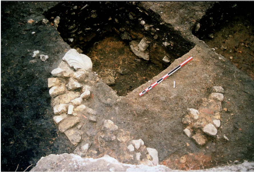
Fig. 7 : Sondage n° 1 : structure circulaire arasée avec le fragment de sculpture en rempli.