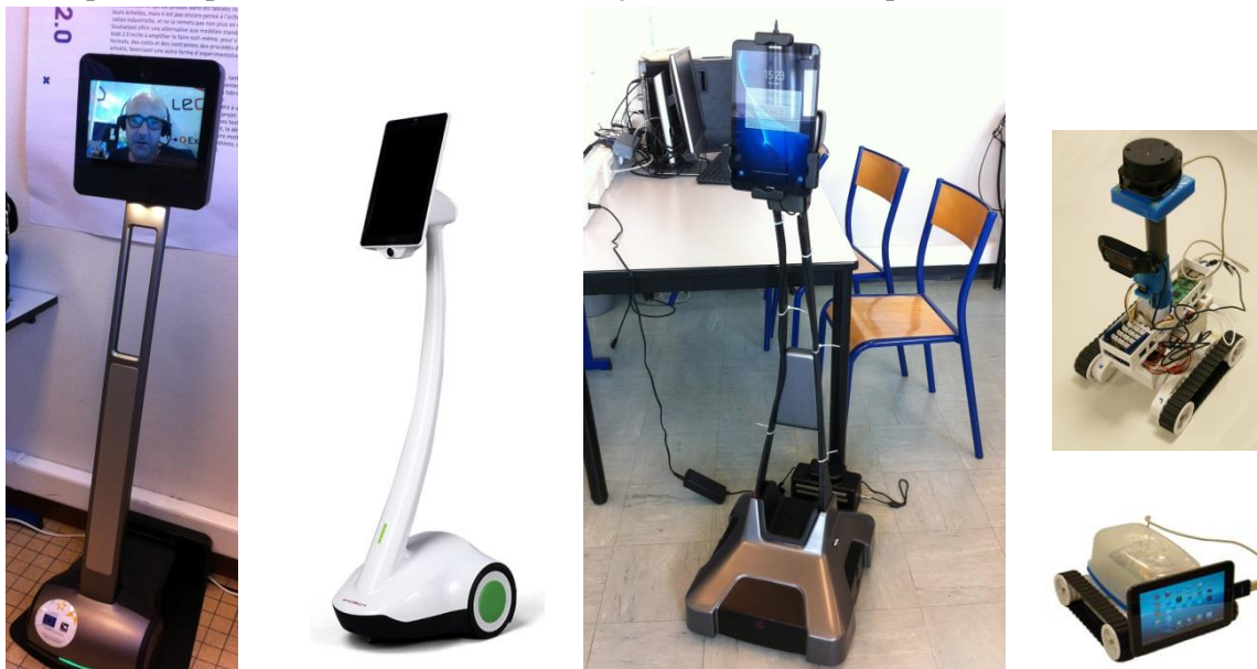
Figure 1 : de gauche à droite, un robot Beam+, un PadBot U1, un UBBO et deux robots modulaires.

En 2017 nous avons découvert que plusieurs constructeurs proposaient des produits concurrents au Beam+, par exemple PadBot [7] et la société française AXYN Robotique [8].