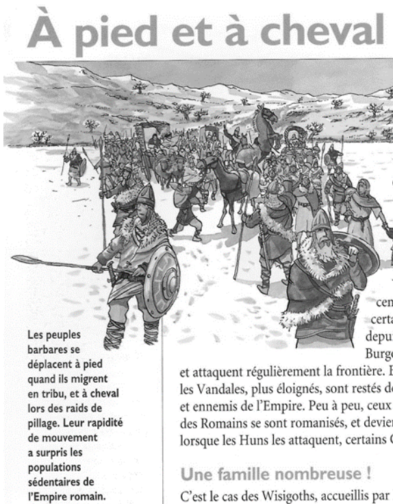
Document n° 1 : Extrait de l'ouvrage (en bas à gauche) lu par Corentin (Doustaly-Dunyach, 2004 : 18)

Un événement signale en effet certaines caractéristiques de la lecture d'un document qui seront utiles pour analyser d'autres événements de la séance. Les élèves sont confrontés à une tâche qui ne constitue pas en soi un problème : ils doivent caractériser les Barbares. Ils cherchent à cet effet des informations dans les documents à leur disposition. Cet événement est initié par Corentin lisant la légende d'un dessin (Document n° 1) représentant une tribu barbare en déplacement (Extrait de transcription n° 1).