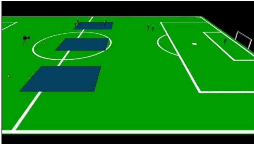
11 Figure 1 : Représentation 3D de la situation d'étude privilégiée