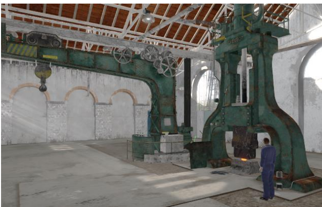
Figure 3 : Extrait de la modélisation des forges de Brest.

En 2014 une prise de données LIDAR effectuée dans le cadre d'une collaboration avec l'Institut Universitaire Européen de la Mer 8 a permis de débiter la modélisation des forges. Cette modélisation est ensuite améliorée par des ingénieurs informaticiens qui se sont également appuyés sur de nombreuses photos prises sur place dans le but d'obtenir une modélisation aussi fidèle à la réalité que possible. Actuellement nous travaillons sur le côté interactif de cette modélisation afin que celle-ci devienne un laboratoire de travail ( Lab in Virtuo 9 ). L'utilisateur de cette modélisation 3D utilise un casque de réalité virtuelle muni de deux manettes lui permettant de réaliser des actions. Il peut par exemple changer de place au sein de la forge, commander la grue, ou activer le marteau-pilon.