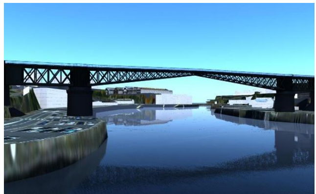
Figure 3 : Extrait de la modélisation du Pont tournant de Brest.

Actuellement deux modélisations 3D ont été réalisées par le CERV (Centre Européen de la Réalité Virtuelle à Brest) en collaboration avec le Centre François Viète : le pont tournant 6 ainsi que les forges de Brest 7 .