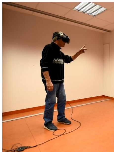
Figure 5 : Un des forgerons durant la démonstration de la modélisation des forges. 8 novembre 2017.

pour les entretiens avec les forgerons car ils nous montrent les ouvriers en plein travail. Nous pouvons donc interroger tout en s'appuyant sur les images des films. Les forgerons ne sont pas de simples témoins mais de véritables experts du domaine. Ce sont eux qui valident le modèle 3D des forges et informent les chercheurs ainsi que les ingénieurs informaticiens des éléments à modifier. Fin 2017, les deux forgerons interrogés ont pu découvrir la modélisation pour la première fois et nous donner leurs impressions. Pour cette première démonstration il s'est avéré que la modélisation était très fidèle à ce que les forgerons ont connus lors de leur carrière. Leurs réactions sont d'ailleurs unanimes : « C'est magique, c'est impressionnant ! Oh oui ça impressionne dur ! D'entendre les bruits du marteau, de la grue, les mêmes bruits exactement ! Oh ouais c'est bien capté ! Oh oui c'est super, ça impressionne ! » 10 L'un des forgerons qui utilise cette technologie pour la première fois déclare même : « Il y a une chose que j'ai remarqué. C'est encore plus impressionnant en 3D que la réalité. Ça impressionne plus » 11 .