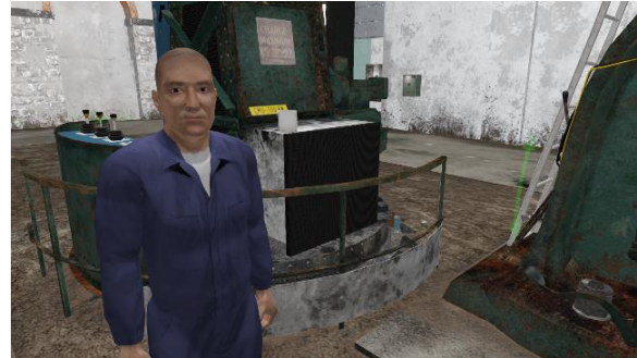
Figure 4 : Entité virtuelle présente dans la modélisation des forges de Brest

s'occupe de l'assistance technique et qui est généralement un informaticien ou un spécialiste de la réalité virtuelle.