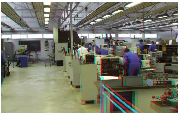
Figure 3 : L'atelier du département GMP de l'IUT de Brest, anaglyphe réalisé à partir d'un cliché stéréoscopique.

Les participants au projet dans la première phase (2011-2013) étaient :