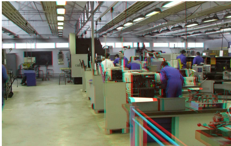
Figure 3 : L'atelier du département GMP de l'IUT de Brest, anaglyphe réalisé à partir d'un cliché stéréoscopique.

Les participants au projet dans la première phase (2011-2013) étaient :