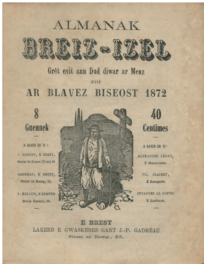
Couverture de l' Almanak .

L' Almanak Breiz-Izel est l'aboutissement du projet de deux hommes, le Parisien Henri Gaidoz et le Breton François-Marie Luzel, qui s'est concrétisé lors d'un voyage en Bretagne en septembre et octobre 1871. À cette occasion, ils se rencontrent pour la première fois, même s'ils échangent une correspondance suivie depuis 1867, date à laquelle l'écrivain Ernest Renan a recommandé Gaidoz auprès de Luzel. L'idée de l'almanach revient à Henri Gaidoz qui, le 19 décembre 1869 en fait part dans une lettre à Luzel. Ce serait, en quelque sorte le pendant de celui publié par les Provençaux, l' Armana Prouvençau , dont il adresse un exemplaire à Luzel en janvier 1870.