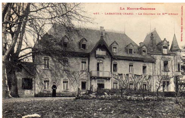
Le château au début XX e siècle

renouvellera lorsque la famille Rolland souhaitera se rendre en Suisse, à l'été 1919. Tous ces faits permettent de mieux comprendre les liens d'amitié indéfectible qui unirent les deux personnages au sortir de la guerre.