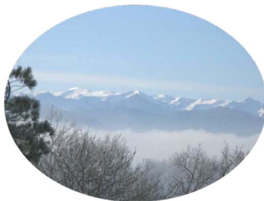
La chaîne pyrénéenne sous la neige, vue du château de Lamaguère 10

Ce paysage bucolique et enchanteur a sans doute aiguisé la curiosité de l'auteur de Jean-Christophe qui aurait peut-être envisagé un séjour dans la région, si la guerre n'était venue anéantir de tels projets.