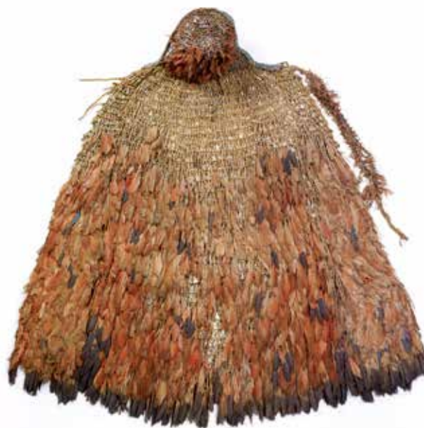
Population Tupinamba, cape de plumes , côte Atlantique, Brésil, XVI e siècle, plumes (ibis et ara bleu), coton, fibres végétales, perles, soie. Paris, Musée du Quai Branly, inv. 71.1917.3.83 D.

La deuxième aire d'expansion coloniale française dans le Nouveau Monde touche à l'Amérique du Sud et à la Caraïbe. La tentative d'implantation des Français dans la baie de Rio de Janeiro au Brésil entre 1555 et 1560, alors baptisée la France Antarctique, est largement connue au travers des relations qu'en ont fait André Thevet comme Jean de Léry (1534-1613); elle s'inscrit dans un mouvement plus global de commerce et d'échanges entre Français et Amérindiens – au premier rang desquels les Tupinambas – sur les côtes du Brésil et qui s'est développé tout au long du XVI e siècle 67 . Liés à cette histoire, quelques rares objets du milieu du XVI e siècle sont parvenus jusqu'à nous, à l'image du casse-tête et de la cape de plumes tupinambas évoqués plus haut. De nouvelles études ont permis de préciser l'itinéraire de ces deux pièces uniques, les plus anciennes rentrées en France au sein des collections du musée du quai Branly. Il est ainsi quasi certain que la cape a été transférée du Muséum d'histoire naturelle au muséum des Antiques en septembre 1797 68 ; elle aurait donc été précédemment conservée