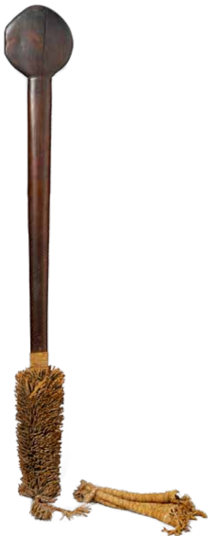
Population Tupinamba, massue ou casse-tête , côte Atlantique, Brésil, milieu du XVI e siècle, bois, coton, fibres végétales, rachis de plumes. Paris, Musée du Quai Branly, inv. 71.1917.3.62 D.