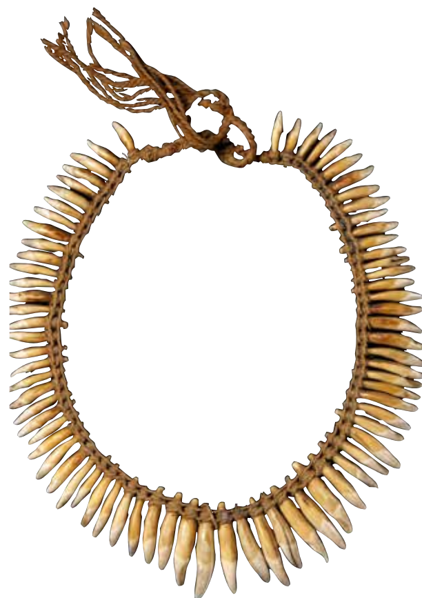
Collier de dents, Guyanes, xviii e siècle, dents animales, coton, fibres végétales. Paris, Musée du Quai Branly (cat. 6.11).

À l'image de ces deux objets tupinambas du xvi e siècle, le musée du quai Branly, dernier héritier d'une longue et mouvementée histoire des collections « exotiques » nationales, conserve aujourd'hui un ensemble important de collections dites « royales » 32 provenant des Amériques. Pour une grande part, celles-ci sont issues des anciens cabinets et du jardin du Roi. André Thevet est le plus ancien « garde » connu de cette collection du Roi ; il a exercé les fonctions de cosmographe de quatre souverains, de Henri II à Henri III. Jean Mocquet (1575- ca 1617) lui succède et, avec lui, le nom de « cabinet des singularitez du roy » est consacré à la fin du xvi e siècle 33 . En janvier 1626, à l'initiative du médecin Guy de la Brosse (1586-1641), Louis XIII fonde le « Jardin des plantes médicinales ». Installé à partir de février 1633 au faubourg Saint-Victor, il devient « Jardin royal des plantes médicinales » par l'édit du 15 mai 1635. Ce n'est qu'en 1729, à l'occasion du déménagement des collections botaniques et ethnographiques de Joseph Pitton de Tournefort (1656-1708) de Versailles vers le cabinet des drogues du Jardin des plantes, qu'est créé le « Cabinet d'histoire naturelle » à l'emplacement du futur Muséum national d'histoire naturelle 34 .