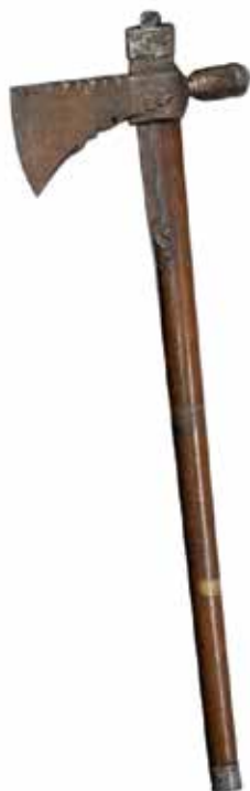
Est, Canada, pipe tomahawk , bois, métal, incrustations de cuivre, argent. Paris, Musée du Quai Branly (cat. 6.10).

au musée d'Ethnographie 56 (coll. 71.1917.3). Quelques objets emblématiques, à l'instar de la célèbre massue tupinamba évoquée, suivent ce chemin.