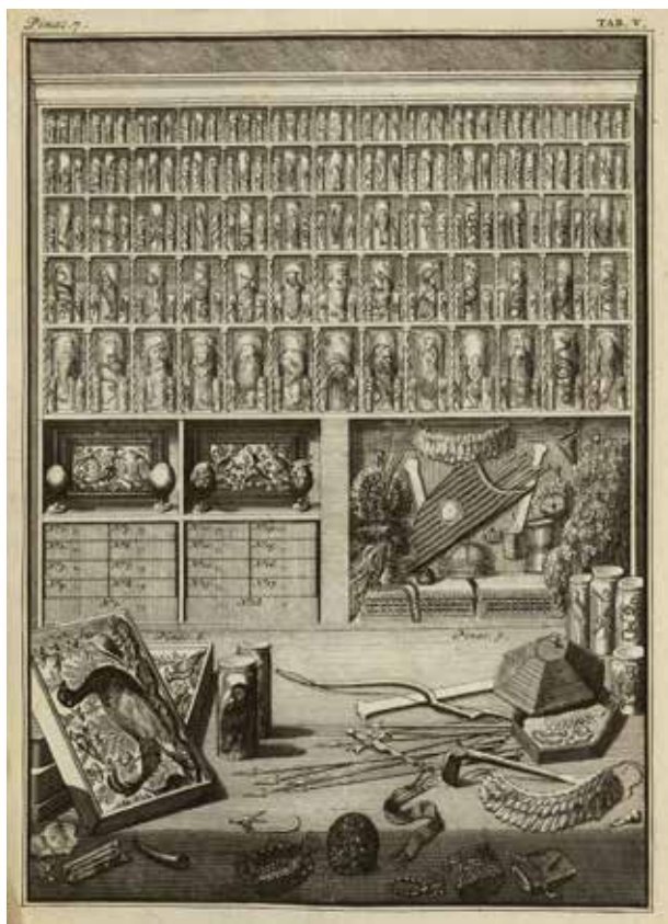
Vincent LEVIN, Elenchus tabularum, pinacothecarum, atque nonnullorum cimeliorum, in gazophylacio Levini . Paris, BIU Santé.

tinité de découvrir un fragment de la vie de l'autre. L'échange, également appelé « trafic », authentifie la rencontre, dans sa bonne entente et son pacifisme, et contente tous les participants. André Thevet (1516-1590) raconte en détail de telles cérémonies lorsqu'il parle de la manière d'acquérir plumes de toucan, garnitures d'épée et autres plumasseries :