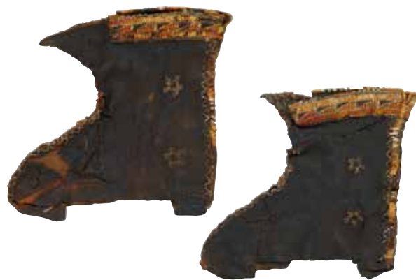
Paire de mocassins , vallée du Saint-Laurent ou est des Grands-Lacs, Amérique du Nord, XVII e siècle, peau de cerf teinte en noir, piquants de porc-épic. Paris, Musée du Quai Branly, inv. 71.1878.265.1-2.

Une troisième institution voit transiter des collections entrant dans notre corpus : le musée d'Artillerie devenu aujourd'hui le musée de l'Armée, à l'Hôtel des Invalides. Héritier du « Magasin d'armes » de l'Arsenal du XVII e siècle, le « dépôt d'Artillerie » est officiellement créé en mai 1794 49 . À côté des armes européennes, le musée d'Artillerie reçoit aussi des pièces exotiques issues des collections royales et des cabinets de curiosités saisies via la Bibliothèque nationale 50 . Ainsi, le 21 juin 1798, les conservateurs du Muséum des Antiques annoncent l'envoi d'objets de la Bibliothèque nationale au dépôt d'Artillerie de la rue Saint-Dominique 51 . L'état des objets accompagnant l'envoi (12 juillet 1798) mentionne plusieurs pièces amérindiennes ou susceptibles de l'être, ainsi que leur appartenance antérieure 52 . Des années plus tard, en janvier 1866, le musée reçoit des « armes et objets divers provenant de la Bibliothèque nationale » 53 . En 1871, les collections conservées dans le couvent des Jacobins sont transférées à l'Hôtel national des Invalides. Bon nombre de ces collections exotiques seront exposées, à partir de 1878, dans une galerie dite ethnographique 54 accueillant 80 mannequins grandeur nature, dont 17 dédiés à l'Amérique 55 . Cependant, en 1917, l'afflux de souvenirs de la Grande Guerre soulève un problème de place et décision est prise de donner « la collection des mannequins exotiques avec leurs costumes et leurs armes »