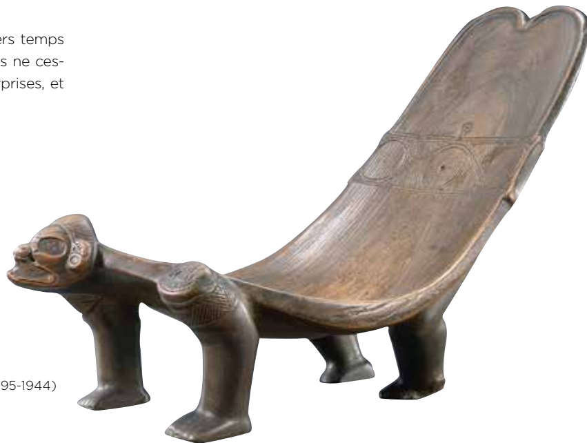
Population Taïno, siège cérémonie / duho, Hispaniola (Haïti, République dominicaine), xv e siècle, bois (gaïac). Paris, Musée du Quai Branly, inv. 71.1950.77.1 Am.