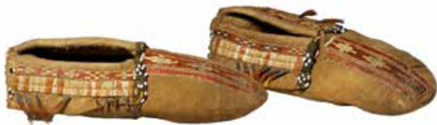
Population Huron ? Paire de mocassins , vallée du Saint-Laurent ou est des Grands Lacs, Amérique du Nord, peau de cerf, application de tissu, piquants de porc-épic, perles de verre, écorce de bouleau, poil d'orignal, cônes de cuivre, poils de cerf teints en rouge. Paris, Musée du Quai Branly (cat. 6.7).