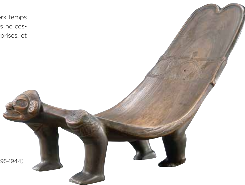
Population Taïno, siège cérémonie/ duho , Hispaniola (Haïti, République dominicaine), xv e siècle, bois (gaïac). Paris, Musée du Quai Branly, inv. 71.1950.77.1 Am.