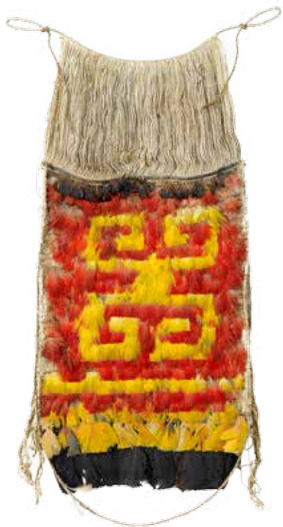
Population Wayana, devantier , Guyanes, xviii e siècle, plumes, coton, fibres végétales. Paris, Musée du Quai Branly (cat. 6.15).

au Jardin du Roi. Une étude très détaillée est en cours qui établit, par exemple, que les plumes ornant cette cape se rapportent, à l'exception de quelques rares, à l'ibis rouge (et non à un ara comme mentionné pour celle de Thevet). De même, le casse-tête a fait l'objet d'analyses poussées dont des datations au radiocarbone qui confirment bien qu'il date du milieu du xvi e siècle 69 . Cependant, d'autres pièces tupinamba sont également présentes dans d'autres institutions muséales. Ainsi l'on dénombre quatre casse-tête «à tête discoïde» caractéristiques au musée des Antiquités nationales, anciens dons du Cabinet d'Histoire naturelle au musée de Marine 70 ; de même la bibliothèque Sainte-Geneviève possède une autre massue de ces Amérindiens des côtes brésiliennes 71 . Tous ces objets témoignent des nombreux contacts entre Français et «Brésiliens» au xvi e et début du xvii e siècles.