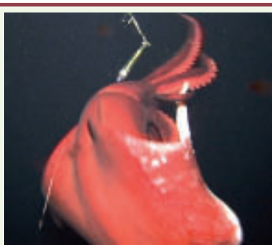
Figure 1. T. danae n'est ni lent ni mou, mais vorace et rapide quand il se jette féroce sur l'appât.

Certaines crevettes, par exemple, ont la capacité d'émettre une encre lumineuse soupçonnée de distraire leur prédateur et parfois même d'attirer les prédateurs de cet agresseur. Beaucoup de poissons des profondeurs possèdent des leures lumineux qui attirent les proies vers leur bouche dotée de dents terribles. D'autres ont des glandes sous-oculaires qui émettent des flashes de lumière. Dans ce cas, une fonction de communication