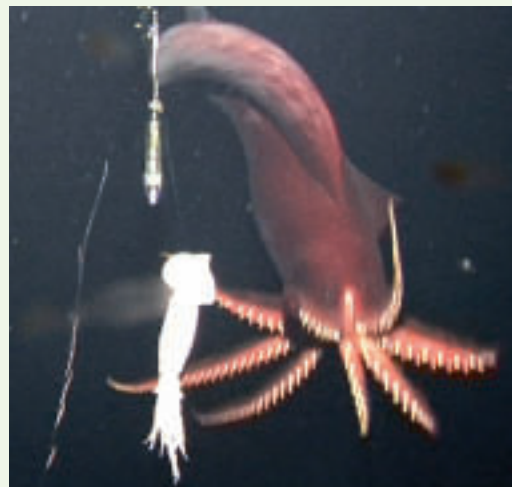
Figure 2. T. danae s'apprête à attaquer l'appât.