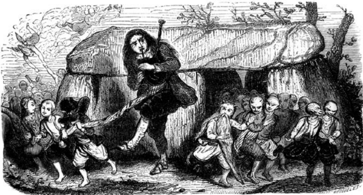
Beuguelet, « La légende du Joueur de biniou », Magasin pittoresque , t. 11, 1843, p. 200. Gravure sur bois debout pour l'article d'É. Souvestre «Lao et les Korigans, Tradition bretonne», ibid. , p. 199-200. - Coll. LIRE, CNRS/Lyon2. Photo Yves Le Lay.

«Tout autre commentaire, à supposer qu'il fût encore souhaitable, serait superfétatoire après les longs extraits que nous avons donnés du texte. Nous en avons assez dit et traduit pour faire comprendre à notre lecteur que la dernière œuvre de M. Émile Souvestre possède un degré d'intérêt et de mérite peu commun dans la production récente des presses parisiennes. Nous disons en outre, chose que nous ne nous risquons que rarement à dire d'un ouvrage appartenant à la classe la plus légère de la littérature française, qu'elle est parfaitement adaptée au goût anglais et peut en conséquence être recommandée aux lecteurs des deux sexes et de tous âges. Une telle mine d'information aussi nouvelle que curieuse sur une paysannerie des plus intéressantes a rarement été proposée dans un style et une forme à ce point attrayants et divertissants 42 .»