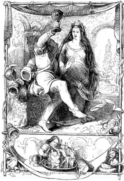
Ludwig Richter, Die Wasserhexe. Gravure sur bois debout pour Volksmärchen aus der Bretagne . Für die Jugend bearbeitet von Heinrich Bode, Leipzig, Otto Wigand, 1847, p. 100. - Coll. part., Lyon.

celle de Blancheneige qui se trouve « derrière les sept montagnes, chez les sept nains », et le plonge ainsi dans le merveilleux qui va suivre 16 . D'autre part, l'une des caractéristiques de la traduction de Bode réside dans le fait – qu'il avoue d'ailleurs dans l'introduction – qu'il a retravaillé les contes, et l'analyse montre que si Bode est resté assez fidèle aux textes de Souvestre, il a systématiquement supprimé les indications locales, les données qui auraient pu provoquer une impression d'exotisme : il a fait disparaître l'idée des quatre foyers (Léon, Trégor, Cornouaille, Vannes), les mœurs trop spécifiques au peuple breton 17 , les expressions linguistiques bretonnes, les noms de lieux auxquels il préfère l'absence d'indication ou des données plus vagues comme « dans un village » ; il a parfois modifié le nom des personnages (Ninorc'h-Madek est devenue Lisbeth, Lao devient Leonard) et a changé le titre des contes qui fournissaient des indications locales comme « Les pierres de Plouhinec » qui deviennent « Les pierres errantes », ou « La Groac'h de l'île du Lok » qui devient « La fée des eaux ».