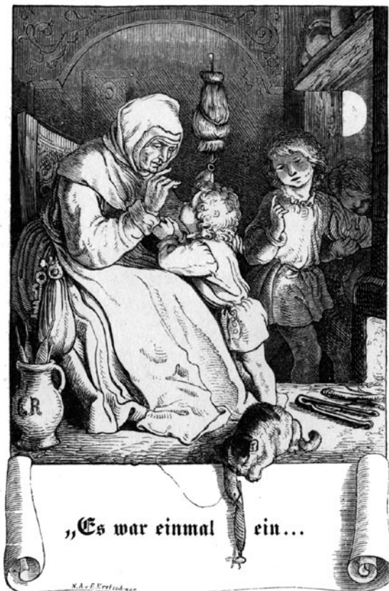
Ludwig Richter, frontispice de Volksmärchen aus der Bretagne . Für die Jugend bearbeitet von Heinrich Bode. Mit Bildern von Prof. L. Richter und T. Johannot, Leipzig, Otto Wigand, 1847. - Coll. part., Lyon.