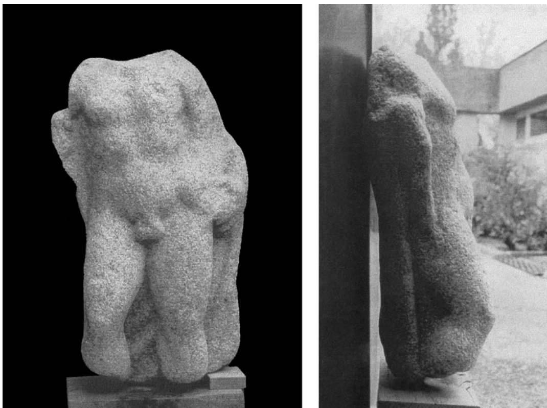
Figure 2 : Statue de Neptune en granite découverte au Ris en Douarnenez ; vue de face et vue de profil droit.

Mais, comme nous le savons, des artistes établis sur place n'hésitèrent pas à faire appel aux granites locaux, pourtant difficilement taillables et à grain plus grossier, pour des œuvres de plus grandes dimensions. C'est ce que confirme aussi une troisième découverte, fortuite celle-là (fig. 2).