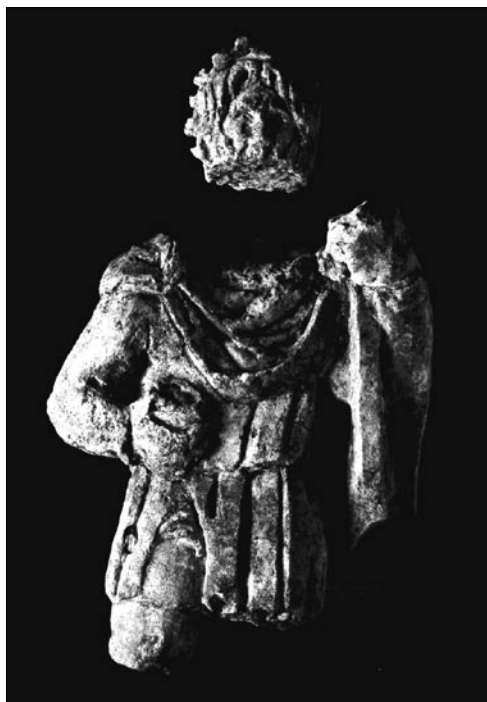
Figure 1 : Statuette en calcaire du dieu au maillet découverte à Rennes, rue de la Visitation.

La seconde œuvre mise au jour en cours de fouilles est une statuette en calcaire provenant du site de la Visitation à Rennes (fig. 1) (responsable, P. Chevet). Cinq fragments ont été récupérés au mois de février 2005, dans le sol d'une rue 4 . Le matériau est un calcaire blanc très fin. D'un personnage de sexe masculin subsistent la majeure partie de la tête (H. : 4,6 cm) et le tronc vêtu d'une tunique courte serrée à la taille (H. : 14 cm). La statuette entière pouvait approcher les 30 cm. Comme le personnage tient dans sa main droite serrée contre le corps un vase globulaire et dans sa main gauche un instrument brisé mais où l'on reconnaît un maillet, on identifie sans ambiguïté «le dieu au maillet» dénommé Sucellus dans certaines inscriptions. La facture est d'un niveau tout à fait honorable compte tenu de la petitesse et donc de la fragilité du matériau. Le dieu au maillet était déjà représenté en Bretagne par une stèle en haut relief de grande taille (1,47 m sans la tête) découverte dans les premières années du XVIII e s. au Rillan en Saint-Brandan (Côtes-d'Armor). Elle avait été sculptée dans le granite local 5 .