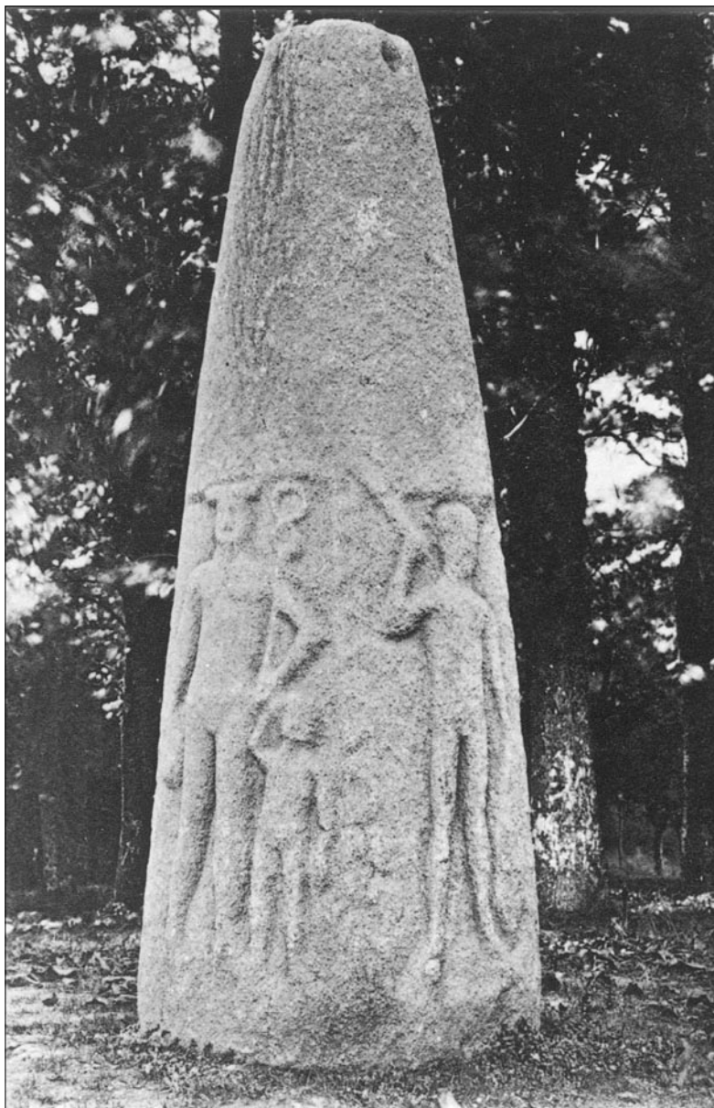
Figure 5 : La stèle de Kervadol sur une carte postale du début du XX e siècle.

être mieux comprise, tant sur le plan des formes que celui du contenu. Elle peut être mise désormais en relation directe, en particulier sur le plan de la chronologie, avec nos connaissances globales sur la romanisation du pays, connaissances qu'ont fait sensiblement progresser ces dernières années les chantiers archéologiques 25 , des travaux de synthèse 26 et la reprise de problématiques en sommeil 27 .