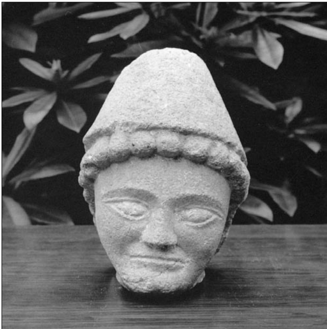
Figure 3 : Tête en granite conservée au musée d'art religieux de l'évêché de Quimper (cl. J.-Y. Éveillard).

L'actualité de la sculpture d'époque romaine en Bretagne c'est aussi un certain nombre de publications récentes portant sur des œuvres anciennement découvertes mais qui étaient restées inédites, ou consistant en des réexamens d'œuvres déjà connues. Pour les premières, signalons une tête que nous avons qualifiée d'énigmatique, égarée parmi de la statuaire d'époque chrétienne au musée d'art religieux de l'évêché de Quimper (fig. 3) 13 . On ignore tout des circonstances de sa découverte (lieu et date) et du cheminement qu'elle a suivi pour arriver à cet endroit. C'est le matériau, un leucogranite du sud-Bretagne, qui permet de dire qu'elle est d'origine locale, et la coiffure du personnage, un bonnet conique du type pileus , qu'on a affaire vraisemblablement à une divinité antique qui pourrait être l'un des Dioscures. Si nos connaissances continuent de progresser grâce à de nouvelles découvertes, il n'est pas impossible qu'elle trouve un jour sa véritable place dans le contexte.